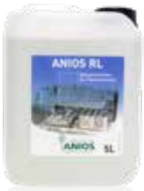
Anios RL 5 L dunk