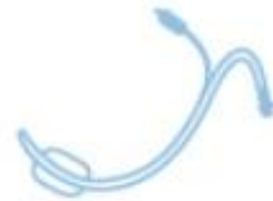
CURVED (Nasal) NORTH